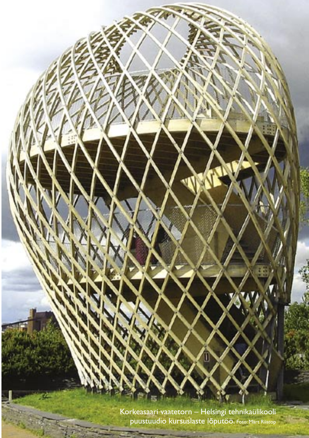
Korkeasaari vaatetorn – Helsingi tehnikaülikooli puustuudio kursuslaste lõputöö.

Puit on kaunis, soe ja kergestitöödeldav materjal, millel on oma iseloom ja ka oma kapriisid. Eestis kui metsariigis võiks puitu rohkem ja vaimukamalt kasutada. Kuid kas me ikka tunneme puitu piisavalt ja kuidas arhitektide teadmisi selles vallas tõsta saaks?