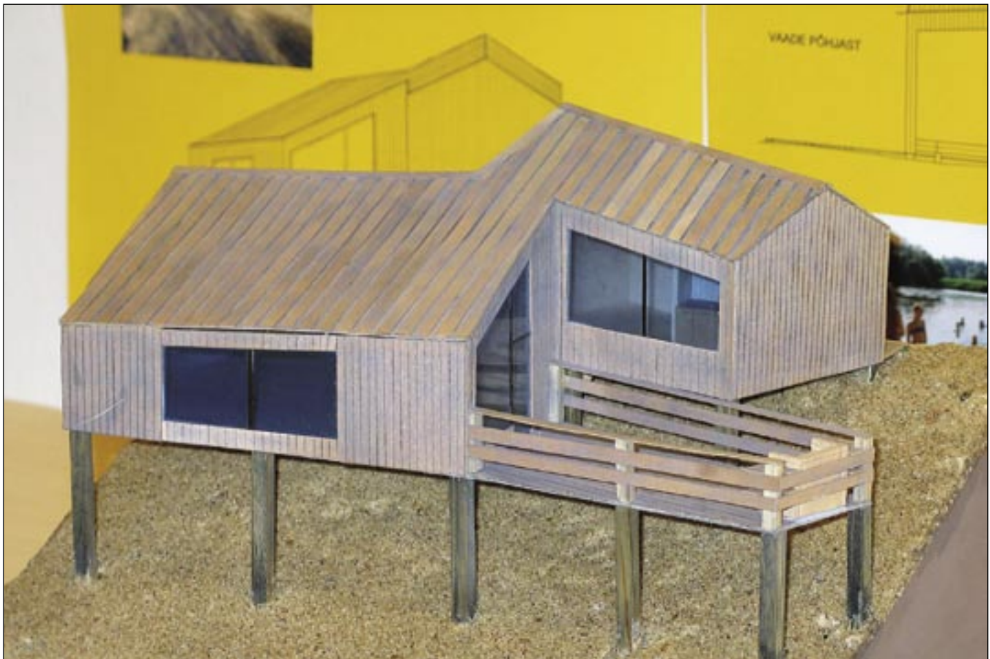
Metsäülikool – loodusesse sulatatud puithoone. (Pirko Võmma, TTK 2. kursus).

nullimiseks ka ei kasutata, tuleb vihma ja päikesega alati arvestada. Puithoone peab olema õigesti projekteeritud, valepidi laudadest loodud katuse veepidamatuses ei saa kuidagi süüdistada saeveskit.