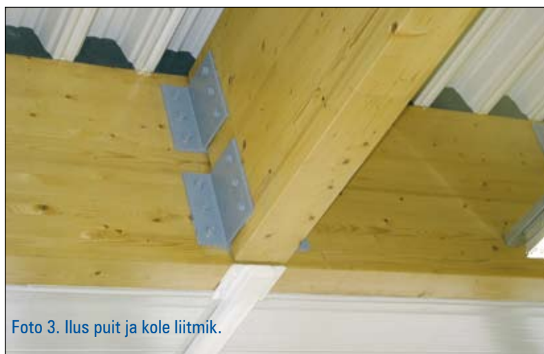
Foto 3. Ilus puit ja kole liitmik.