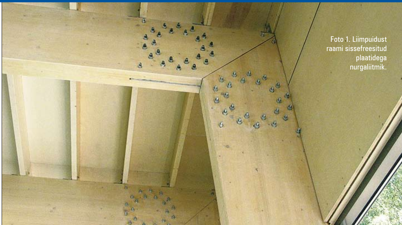
Foto 1. Liimpuidust raami sissefreesitud plaatidega nurgaliitmik.