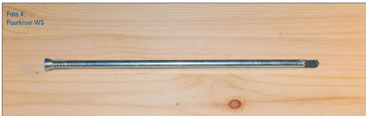
Foto 4. Puurkruvi WS