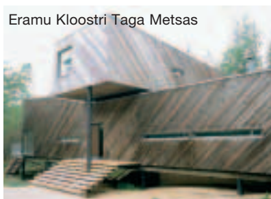
Eramu Kloostri Taga Metsas