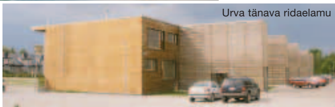
Urva tänava ridaelamu