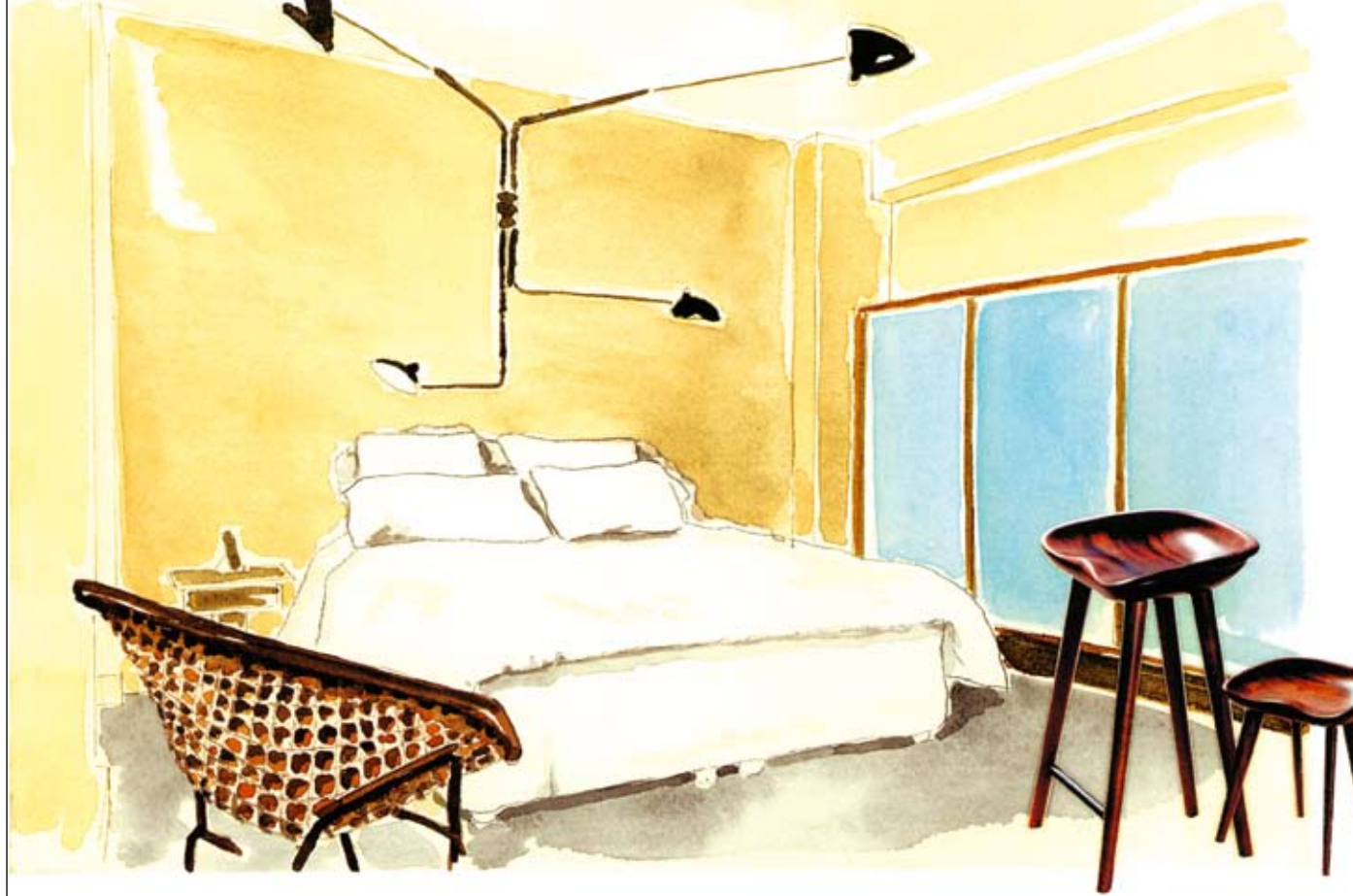
Joonistel: Visioon interjööritrendist 2007 teemal «Emotsionaalne puit».

süntheetika, sageli kulla- või hõbedaläikeline, samuti võrk.