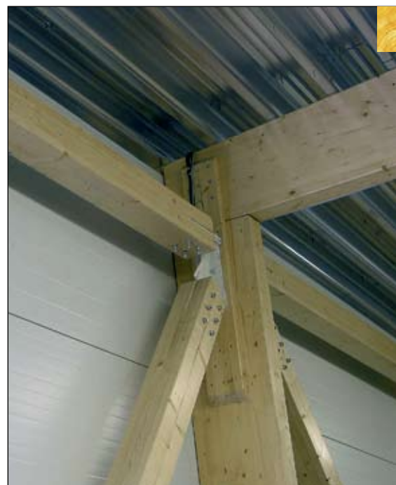
Foto 3. Liimpuitkarkassi liited on kergesti lahti monteeritavad. Uue sorteerimisliini paigaldamiseks tuli Viiratsi saeveskist suur osa lammutada, ent see võttis aega vähem kui kümme päeva.