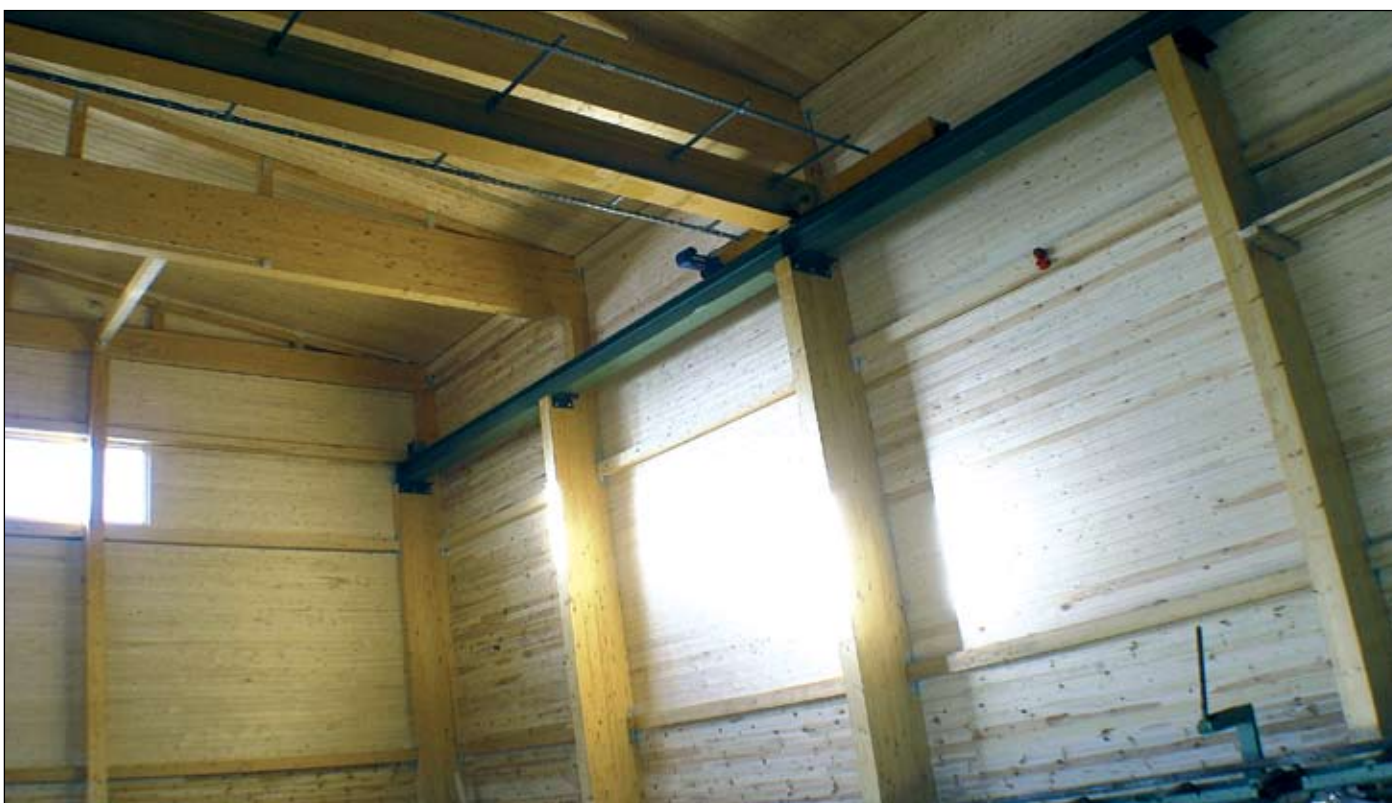
Foto 6. OÜ Peetri Puit Põlvas oskas liimpuitpostidele kinnitada ka telfri talad, sisevooder ja lagi on männilauast.