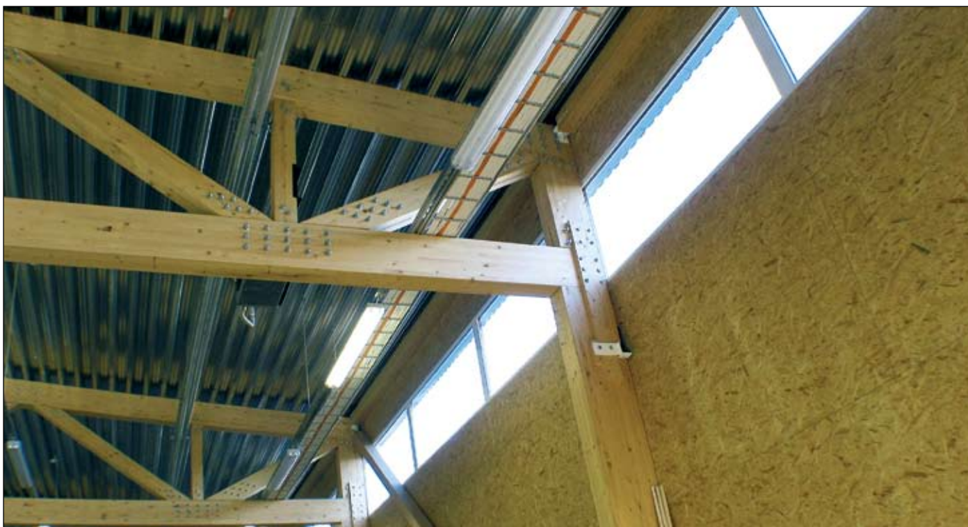
Foto 5. AS Palmako uue tootmishoone siseseinad on kaetud OSB-ga, mis annab ruumile hoopis soojema väljanägemise kui seda suudaks plekk (vt ka artiklit puitehitiste arhitektuurivõistlusest lk 3–6).

muidugi ka spoonkihtpuit, kuid et Eestis seda materjali ei toodeta, siis ei ole seda tootmishoonete karkassis seni kasutatud. Sagedamini kasutatakse meil spoonkihtpuitu keerukamate betooniraketiste tegemisel.