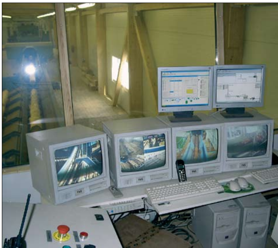
Foto 2. Viiratsi saeveski operatori tööpost on igati kaasaegne – liimpuit sobib sinna ülihästi.