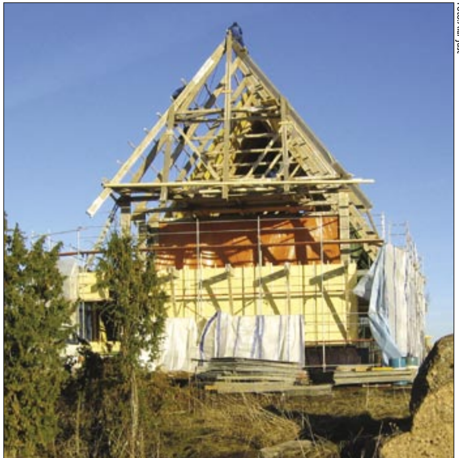
Kadakate ja kivide vahele kerkib klubihoone. Märts 2005.

Kuna klubihoone on vaadeldav väga pikkades perspektiivides, on tema arhitektuurne maht kujundatud jõuliseks, ajalooliseks, maamõisa/rehielamu