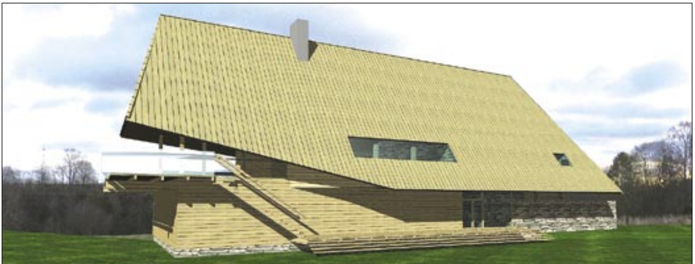
Golfimängijad saavad uue koha ja Eesti arhitektuur juurde kena puitehitise.